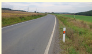
...a po opravě