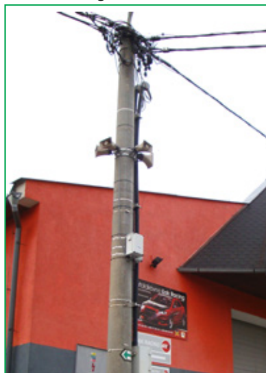
Nové hlásné body varovného systému v Dolní Vlkyši...