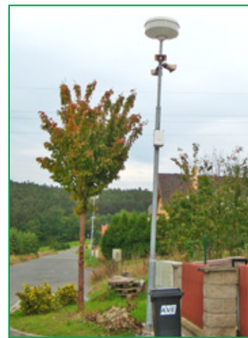
...a v Malesicích